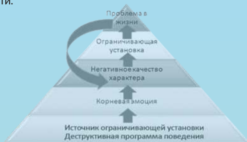
Рисунок 1 – Роль ограничивающих установок в формировании проблем

Согласно А. Эллису, такие установки имеют характер предписания, требования, приказа. В связи с этими особенностями дисфункциональные (ограничивающие) установки вступают в конфронтацию с реальностью, противоречат объективно сложившимся условиям и закономерно приводят к дезадаптации и эмоциональным проблемам личности.